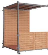
Élément de section centrale