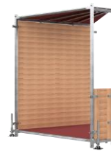
Élément d'angle Type I