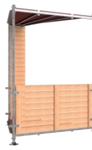
Élément d'angle Type A