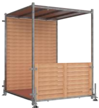
Élément de début et de fin